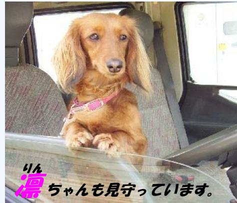
りんちゃんも見守っています。