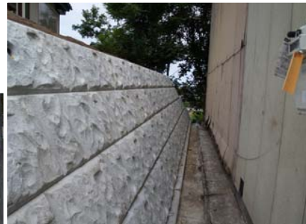
←↑よう壁や コンクリート堀など の宅地の補強工事