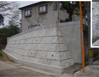
←石灯籠の復旧工事